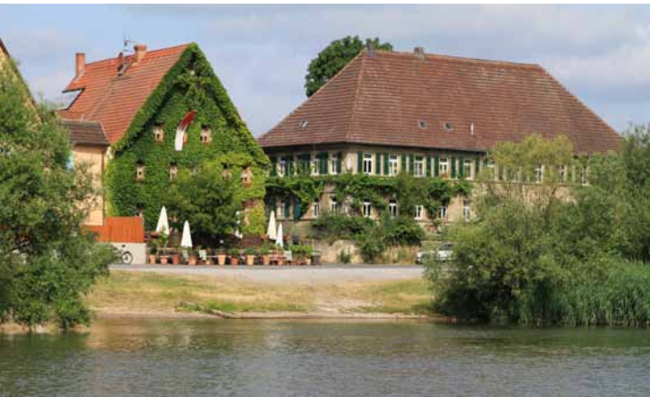
Mainlände mit ehemaliger Fähranlegestelle

Das zweistöckige Fachwerkhaus mit der Jahreszahl 1747 und dem Dorfwappen über dem Eingang ist schon auf einer Abbildung aus dem Jahr 1597 zu sehen. Hier kehrten über Jahrhunderte Schiffer, Flößer und Benutzer der Mainfähre ein. Es diente später auch als Kanu-Club-Station und Ruderunterkunft. Wie auch das Nachbarhaus zur Linken mit seinem verputzten Fachwerkgiebel, prägen beide Gebäude mit ihren Giebelseiten die Dorfansicht zum Main.